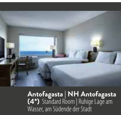
Antofagasta | NH Antofagasta (4*) Standard Room | Ruhige Lage am Wasser, am Südende der Stadt

9. TAG SAN PEDRO DE ATACAMA | Nach dem Frühstück erleben Sie Chuquibambilla, das größte Kupferbergwerk der Welt. Vorbei an riesigen, ausgemusterten Stahlkolossen, Klärteichen und arbeitsamer Hektik geht es zu dem riesigen Krater, bis zu einem Kilometer tief. Winzig scheinen die Maschinen und Lastwagen, die man weit unten arbeiten sieht. Anschließend besuchen Sie den Salar de Atacama, einen Salzsee von gigantischen Ausmaßen: 3000 km 2 ! Hier liegen nicht nur die weltweit größten Lithium-Lagerstätten, hier können Sie auch die Flamingo-Arten Chilenischer Flamingo,