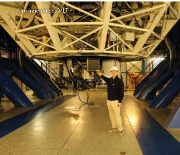
Im Inneren des VLT