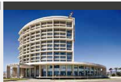
La Serena | Hotel De La Bahia (4*) Standard Room | Direkt am kilometerlangen Strand