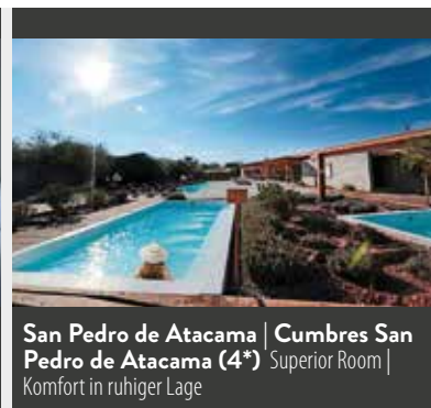
San Pedro de Atacama | Cumbres San Pedro de Atacama (4*) Superior Room | Komfort in ruhiger Lage