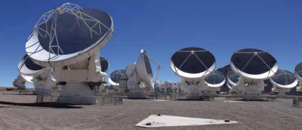
Die vier Hauptteleskope des VLT