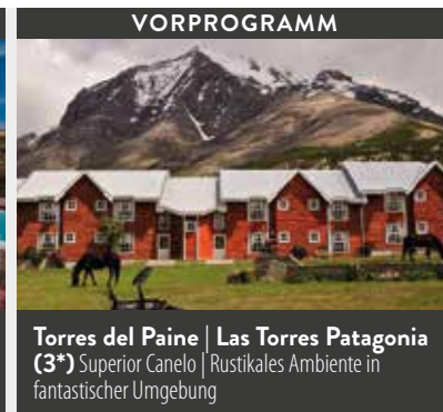
Torres del Paine | Las Torres Patagonia (3*) Superior Canelo | Rustikales Ambiente in fantastischer Umgebung