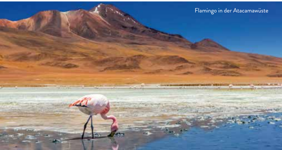
Flamingo in der Atacamawüste