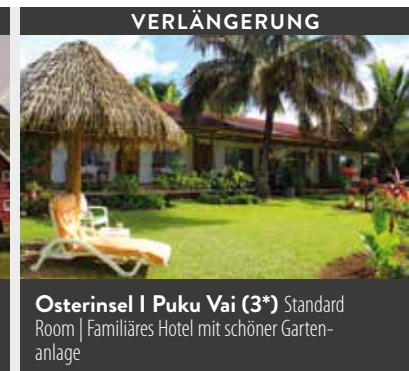
Osterinsel | Puku Vai (3*) Standard Room | Familiäres Hotel mit schöner Gartenanlage