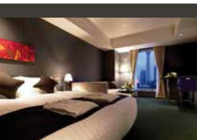
Tokio | The Gate Hotel Asakusa Kaminarimon by Hulic (4*) Standard Room | Gute Lage

Erkunden Sie die faszinierende Stadt auf eigene Faust und bleiben Sie noch ein paar Tage in Kyoto. Leistungen: 3 Übernachtungen im Vessel Campana Hotel (3.5* | Standard Room), Frühstück, (Transfer nicht inkludiert).