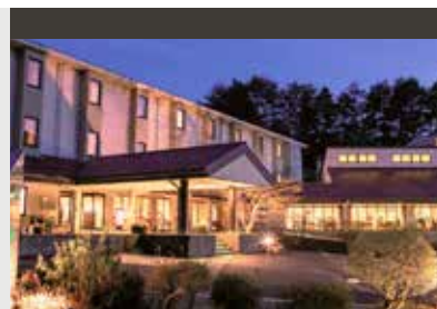
Kiso | Morino Hotel (3*) Japanese Room | Traditionelles japanisches Hotel