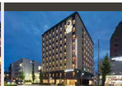
Kyoto | Vessel Campana Hotel (3.5*) Standard Room | Zentrales Hotel im Herzen von Kyoto